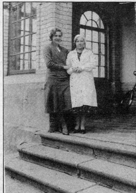
Kodumajanduskooli sissekäik 1933.

*Kui kooli siga ära tapeti pandi meid soolikaid harutama ja puhastama. Sidusime rätikud nina ette. "Kodus te