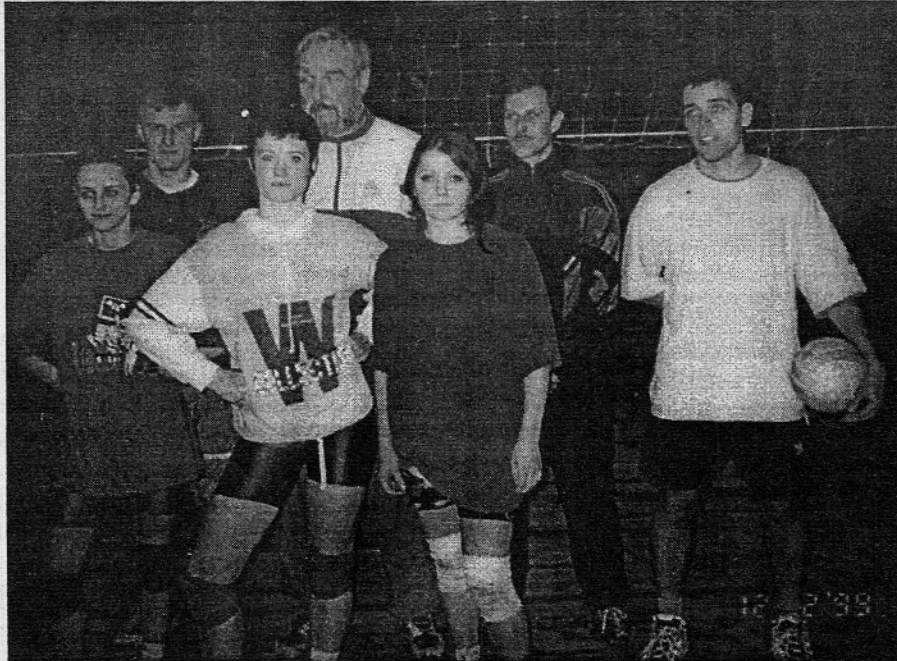
Võidukad võrkpalli võitjad.