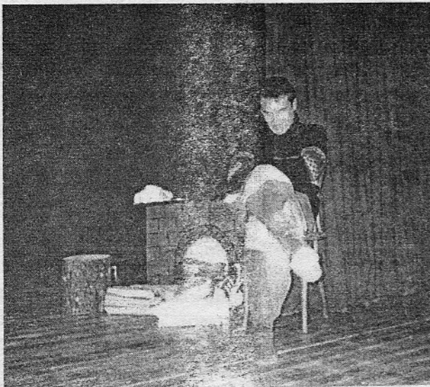
Millega ma nüüd hakkama sain?

küla" poisid ja tüdrukud on alati seltsimajja toonud suure hulga rahvast, nii ka seekord. Kui lava poolt vaadata, siis on hea meel tõdeda, et tuntud tegijate kõrvale on tulnud edukalt ka uued näitlejad ja näitejuht. Professionaalne kriitik hakkaks nüüd norima, et mis, kus ja kuidas, aga tuleb tõdeda, et meie tublid näitajad käivad koos oma vabast ajast -