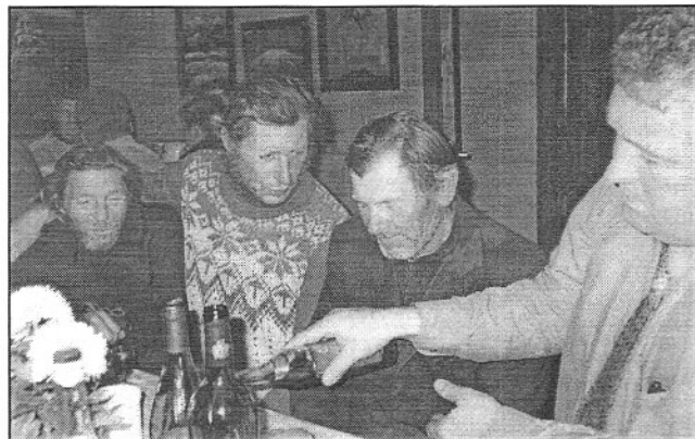
... ia kolme Maniia meest nägin ka

... ja puhkajaid jagub saarele suvel - Riida turismitalu annab väikesaarele oluliselt ilmet juurde. Aga inimesele, kes tahab nautida merd, üksindust, segamatult puhata ja lihtsalt tunda, kuidas aeg sinust läbi voolab ja kõik maailma mured olematuks kahanevad - neile küll nii lähedal paremat ja