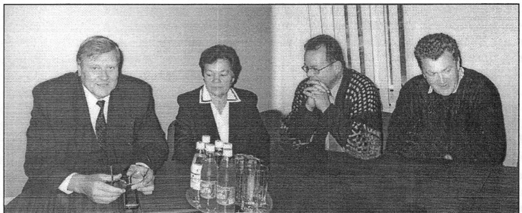
Värsked jõud volikogus