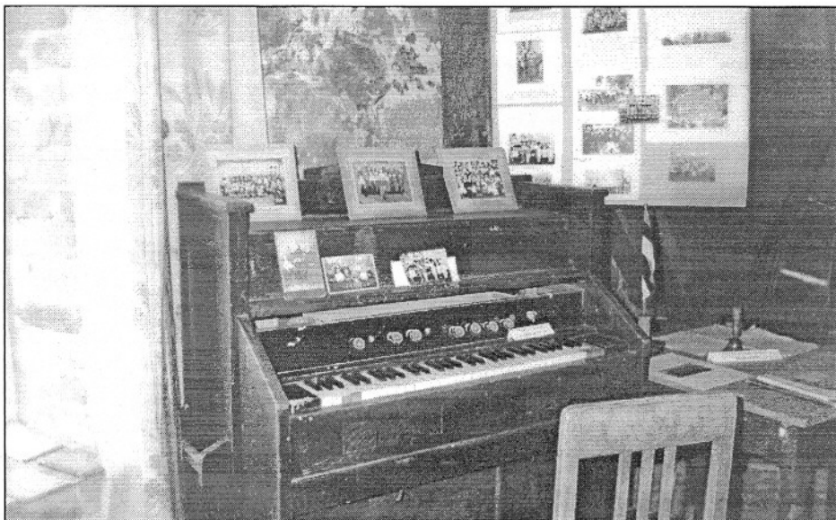
Hariduselu nurgake muuseumitoas. Selle sajandivanuse harmooniumi järgi laulsid lapsed viimati 1982. aastal.

“Tänane päev jääb meile – kunagises Tõhela koolimajas (rahvamajas) kokkusaanule meelde mälestusväärse päevana – Tõhela muuseumitoa avamise päevana. Sellest muuseumist on Tõhela rahvas rääkinud aastakümneid, selle jaoks on hoitud endisaegseid töö- ja tarberistu, hoitud vanu fotosid, talletatud mälestusi. Kõik muuseumi sünnile kaasaitajad olgu tänatud.” Sellised read on