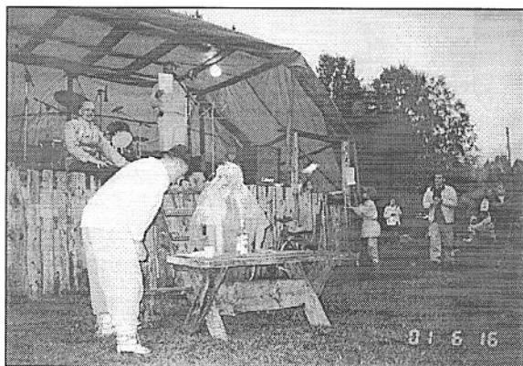
Parim Meespeosa ja Parim Naispeosa oma osa ette kandmas (p.s.-pudelis ehtne viin)