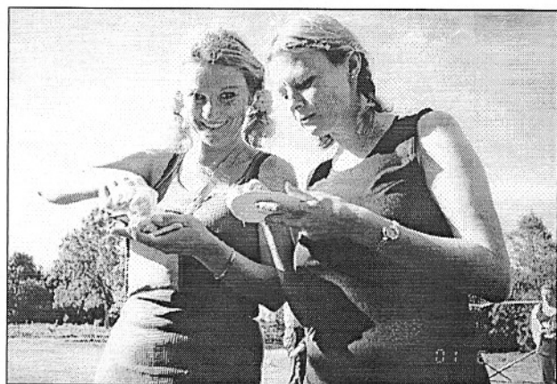
Nagu alati on piletimüüjad platsis... ja pilet oli juba miinus 25 senti