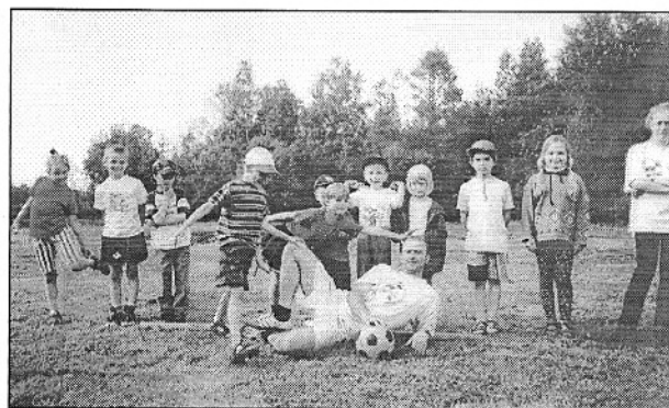
Seltsi president: "Au on olla lastega ühe pildi peal!"