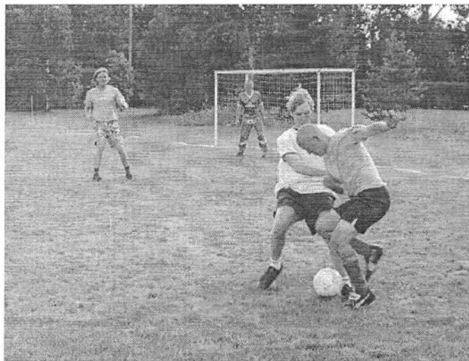
Poolfinaal Linnugripi ja Dünamo vahel