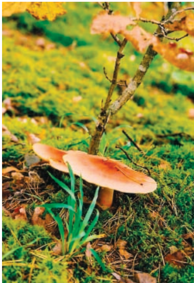
2x Janely Kuuskler

Raine Viitas, fotokonkursi korraldajate nimel