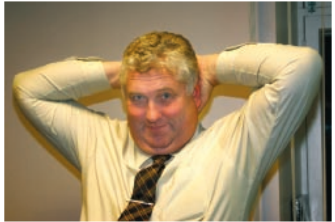
Selle aastaga peaksid sotid sirged olema.