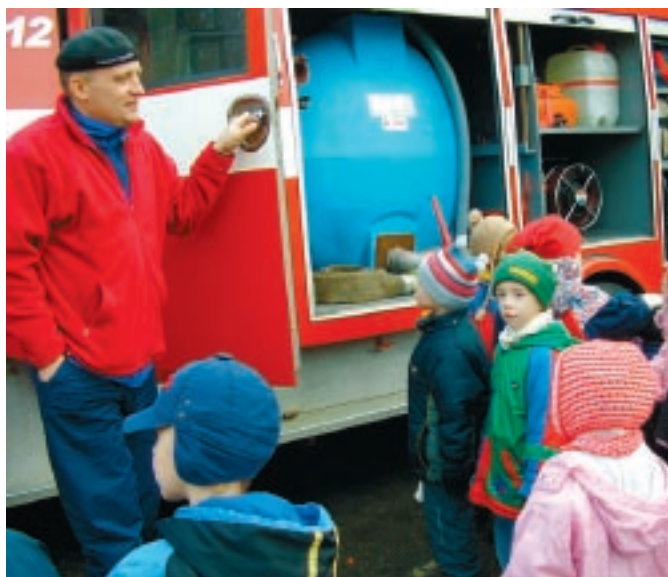
Tuletõrje auto juures uudistamas.