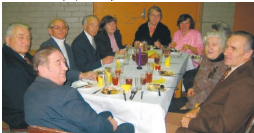
Ägedamad tantsulõvid olid koondunud ühte lauda.