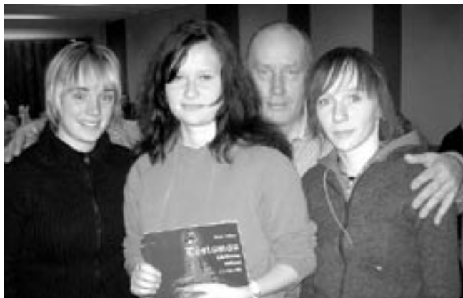
Kolmanda koha saavutanud võistkond koos mängujuhiga.