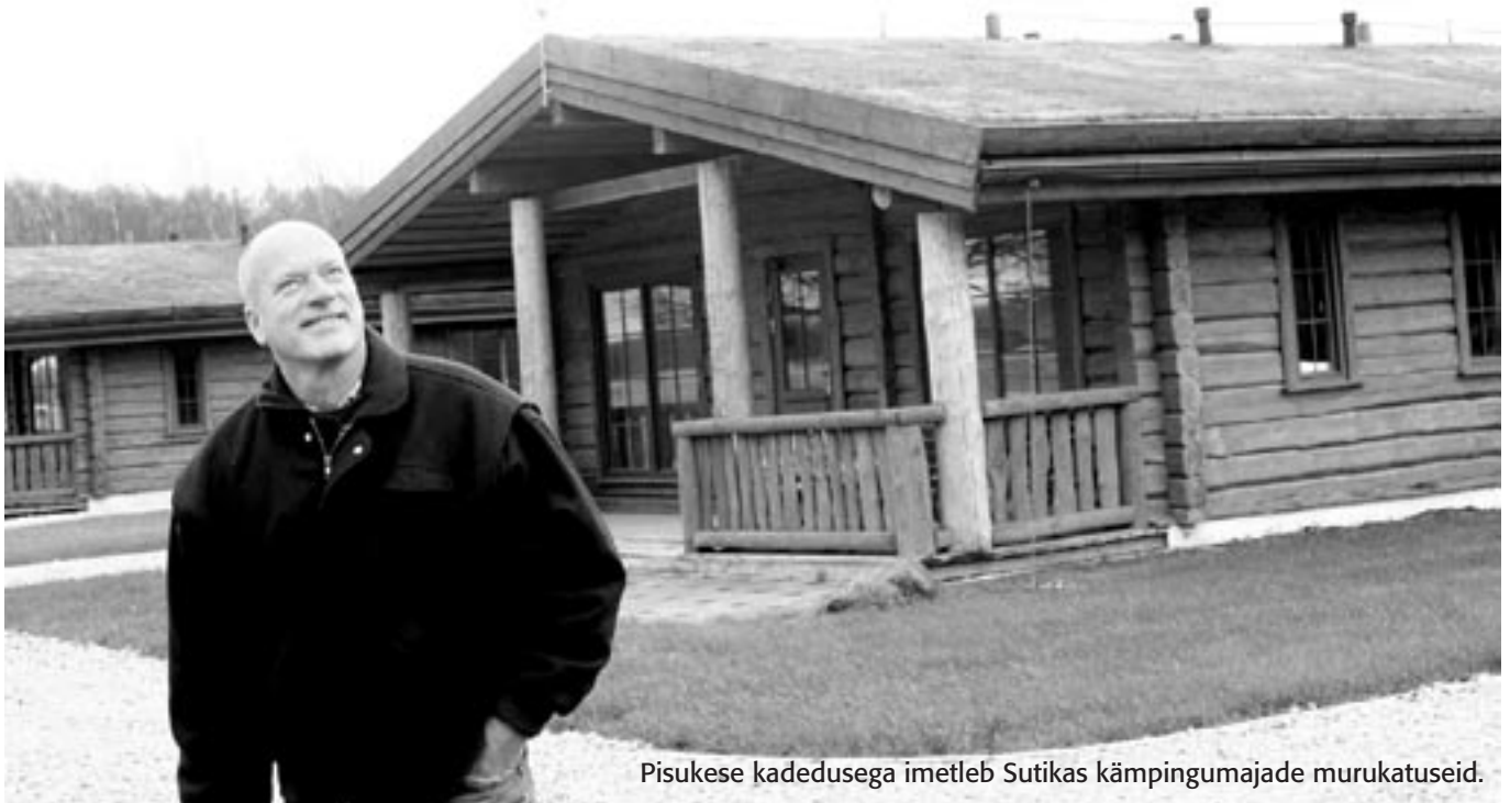
Pisukese kadedusega imetleb Sutikas kämpingumajade murukatuseid.

Juba kümme aastat on Pärnu maavalitsus korraldanud koolitus- ja õppereise maakonna turismiettevõtjatele.