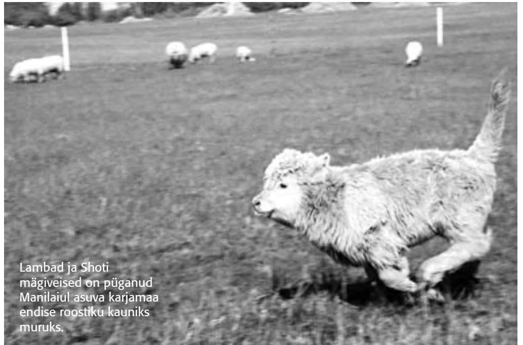
Lambad ja Shoti mägiveised on püganud Manilaiul asuva karjamaa endise roostiku kauniks muruks.

Nüüdisajal näeme niitude kunagisest rikkusest vaid riismeid: siin-seal kinnikasvavad puisniidulapid ning roogu kasvanud kunagised rannaniidud. Üht-teist on viimastel aastatel suudetud loodushoiutoetuse või muude toetuste abil majandada. Vähemasti võivad huvilised turistid mõnes kohas oma silmaga näha, milline oli sinne tavaline maastik veel aastakümneid tagasi. Praegusajal on üsna raske öelda, kui suur on Tõstamaa valla niitude pindala. Rohumaade andmebaasi peab pärandkoosluste kaitse ühing, kes sel aastal inventeeris ka Tõstamaa valla rohumaid. Nüüd sisestatakse välitööandmeid ja töödeldakse neid, nii et ilmselt mõne kuu pärast saaks avaldada täpsemaid arve rohumaaude nüüdisaegse