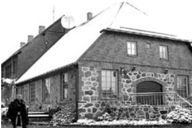
Tüüpiline Läti maja - tellist, maakivi, kivistust ja suurejoonelisust, aga ööbida oli siin mõnus.

kõrtsist välja ja Sutika priskeid Ermistu angerjaid hävitasime keskööl hotelli fuajee nahkdiivanitel otse purgist taskunoaga.