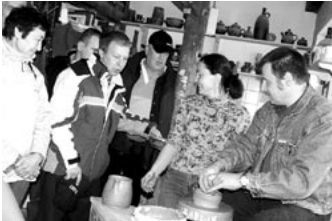
Eesti meeste esimene pott just päris hästi välja ei tulnud.