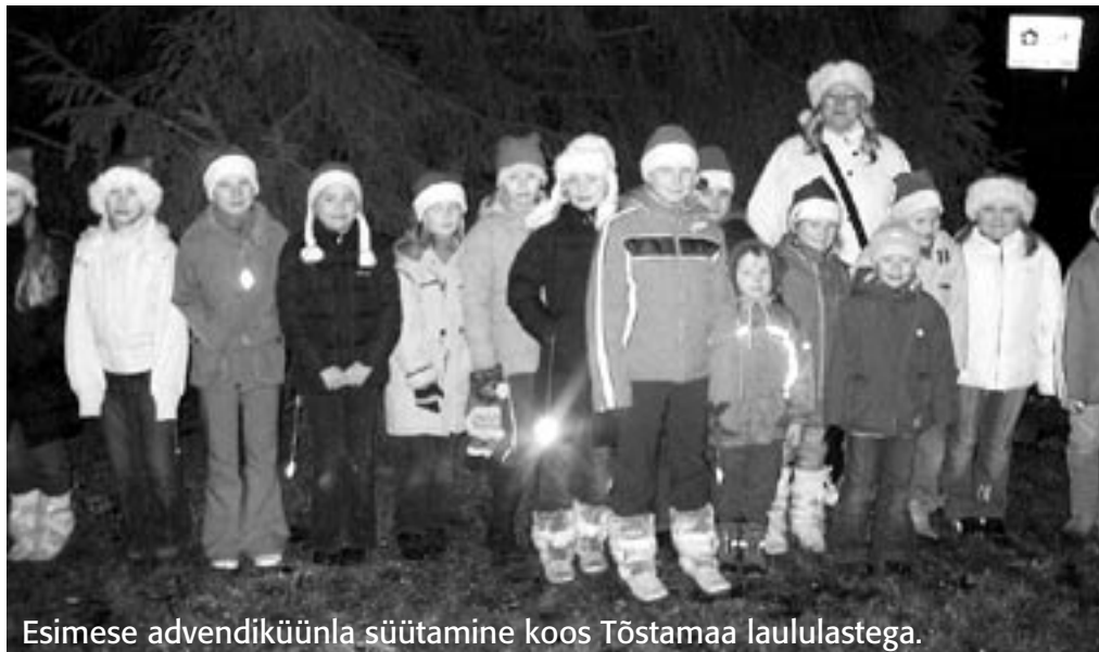
Esimese advendiküünla süütamine koos Tõstamaa laululastega.