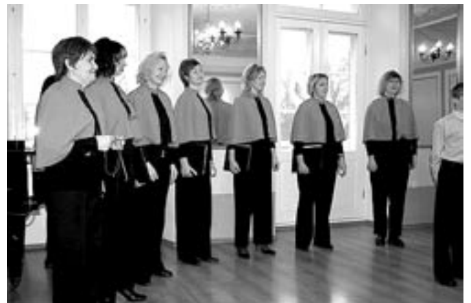
Eesti Raudtee Segakoori kontsert Tõstamaa mõisas tähistas teist adventipüha.

□ Detsembris oli tulekahju 5-ndal kuupäeval kell 18.47, kui Tõstamaa vallas Värati külas põles suvila. Hoone hävis tules 50% ulatuses.