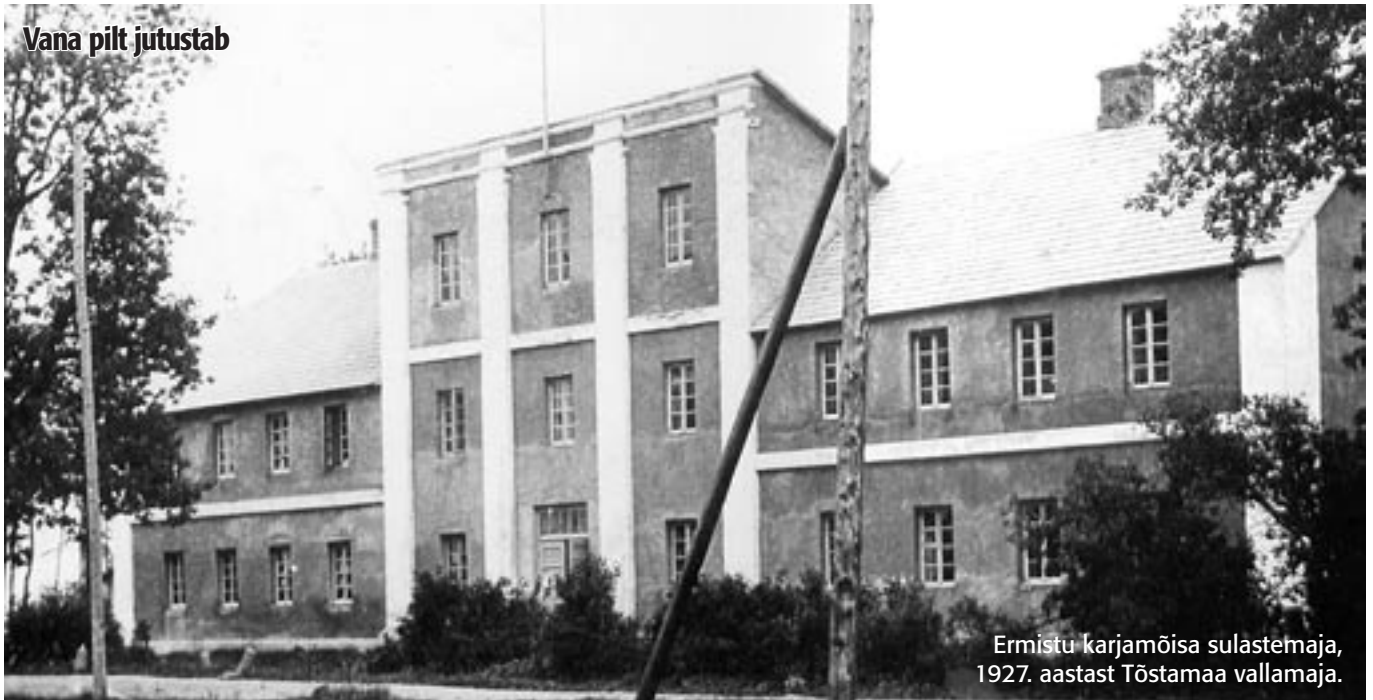
Ermistu karjamõisa sulastemaja, 1927. aastast Tõstamaa vallamaja.