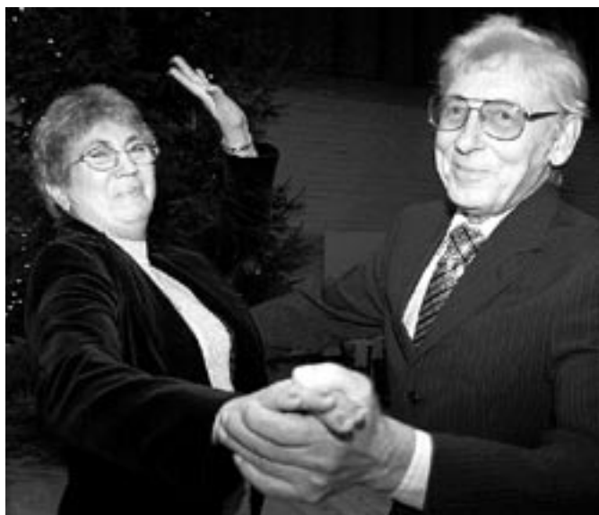
Esimene tantsupaar Tõhelast.