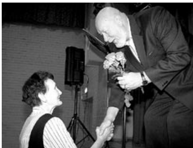
Lilled oma lemmiklauljale.