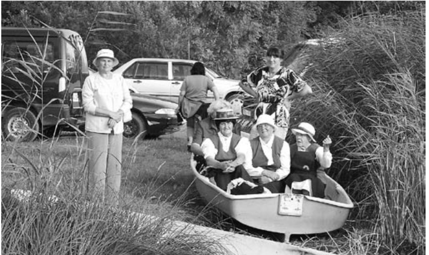
Elu tuleb ikka mõnuga võtta.