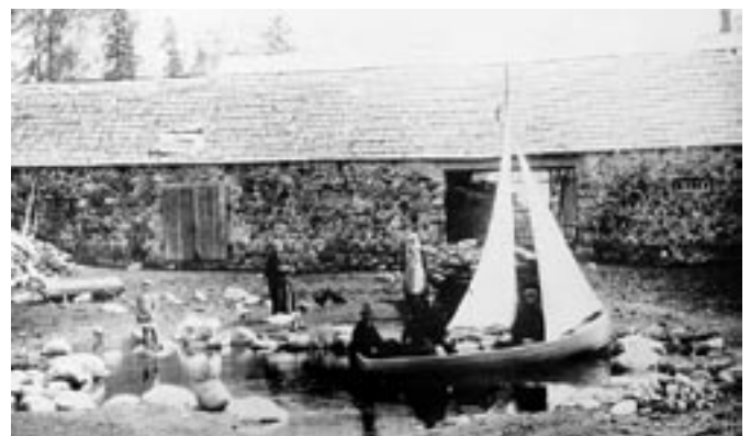
Haruldane pilt Ermistu karjamõisa siseõuest 1920.aastate paiku purjepaadiga tiigil.