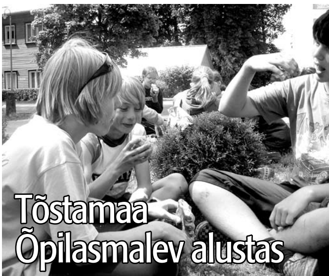
Tõstamaa Õpilasmalev alustas

Tõstamaa Õpilasmalev alustas selle suve tegevusega kohe pärast õppetööd. Energiapuuduse üle meie õpilased küll kurta ei saa, sest tööle tahtjate nimekiri oli väga pikk ja kõik soovivad paraku lõõgile ei pääsenudki.