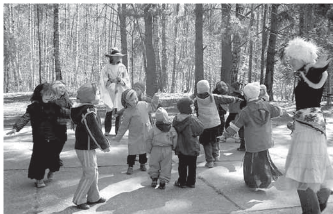
Noidade pidu laululaval.

Tund hiljem, kell 10 ootame külla kõiki beebisid ja 1-2 aastaseid mudilasi koos emmede või issidega. Beebikooli juhendab kogemustega õpetaja