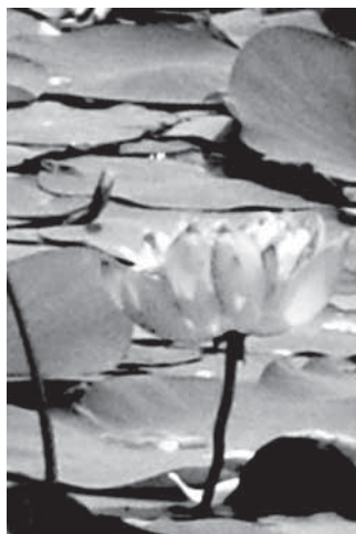
Indias on palju värve, neist igaüks ilus ja erk. Üheks kaunimaks vaatepildiks olid sügavroosad lootoseõied.

Ajurveda on kogemus, millest tunnen siiani puudust ja milleta ei tahaks ma võimalusel pikalt ilma olla. Nimelt on Goas kümneid ja kümneid erinevaid ajurveda keskuseid, kus on võimalik tellida erinevaid massaaže ja meie mõistes spa-hoolduseid ning mis