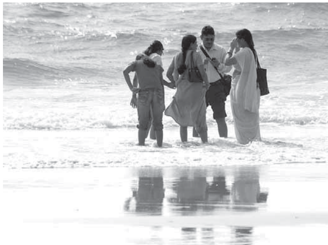
Kohalikud ookeanis hullamas.

Peale päikese jumaldan ma Goa randade juures sealset ujumiskogemusi. Pole midagi lahedamat, kui „mürada“ murdlainetusega ja vaadata kumb on tugevam, kas priske maarjamaa naine või