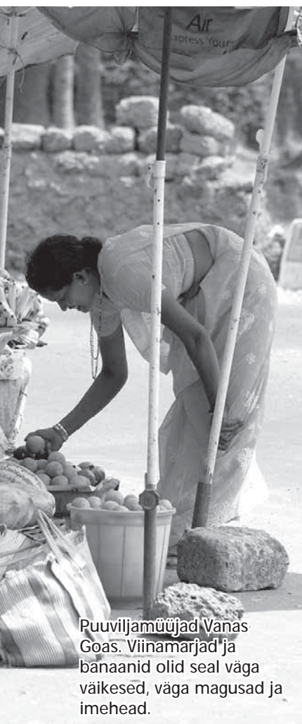
Puuviljamüüjad Vanas Goas. Viinamarjad ja banaanid olid seal väga väikesed, väga magusad ja imehead.

ookeani äärde. Meil oli sellega nii kiire, et unustasime maha ka päikesekaitsekreemi. Veetsime esimesel päeval rannas kuskil viis tundi, mille tulemusi ravitsesime terve järgneva nädala. Mina ajasin selle ühe päevitamise (pigem nagu pannil praadimise) tulemusena kaks korda nahka ja sain sellise koguse tedretähne juurde, et kajakamune võiksin kümme järgnevat kevadet rahumeeli üle kirjata. Hea asi on see, et pruun jume on mul siiani ja sellist ma tavaliselt Eestimaa harvadel päikesepäevadel küll kätte ei saa.