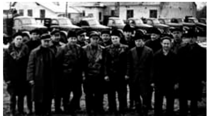
Autopark koos juhtidega nüüdse päästeameti hoovil.