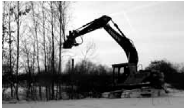
Giljotiin löikab võsa nagu sulavõid.