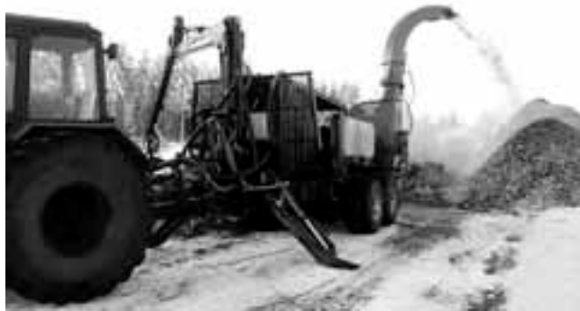
Suurtest haohunnikutest jahvatatakse kütet, mis mühiseb.