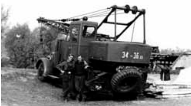
Sõjaväes sai Villem kõva kraanajuhi koolituse.