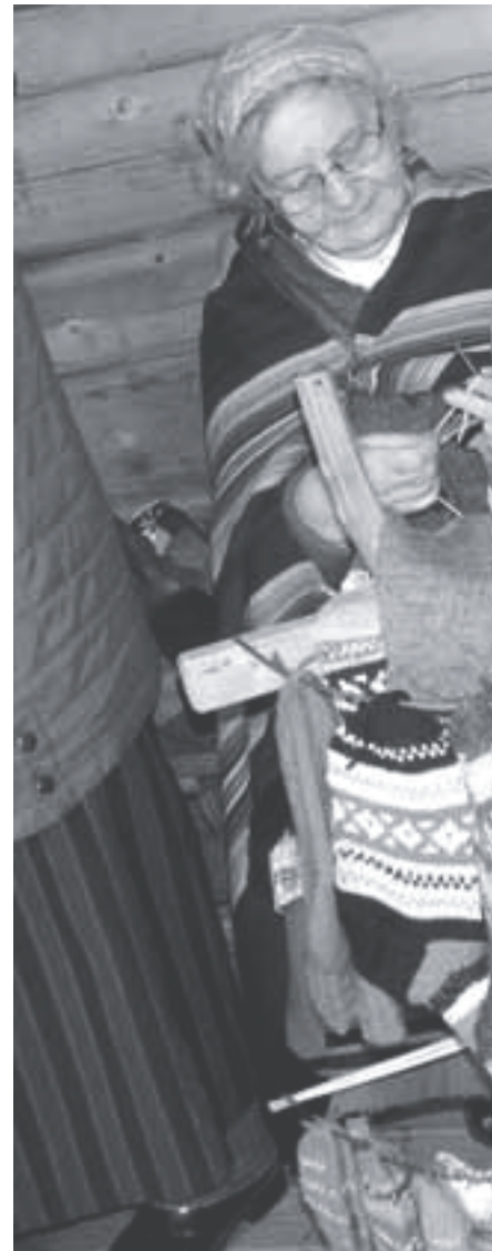
Käsitöö laadal sai näputöö tegemist vaadata.

Laupäeva hommikul vurasime lakkamatus sajas Vaasa linna vaatama. Kajuks otsustasid kuuekümnendate poliitikud, et tuleb lammutada va-