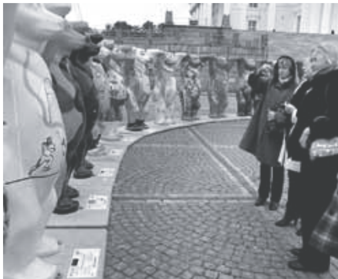
Eri riikide poolt värvitud karud Helsingis sümboliseerisid lugupidamist üksteise vastu maailmas (esiplaanil Eesti karu).

duslikult liigirikas, pesitseb palju linde, hülgeelu on vilgas ja kalu on rikkalikult. Björköbys taastati vana kalavastuvõtu- ja soolamispunkt. Selleks kirjutati Leader projekt, tehti koos külahavaga palju talgutööd, taastamisel kasutati vanu materjale. Neid otsiti kokku kogu maalt, juurde ehitati ka veidi tänapäevasem suvekohvik.