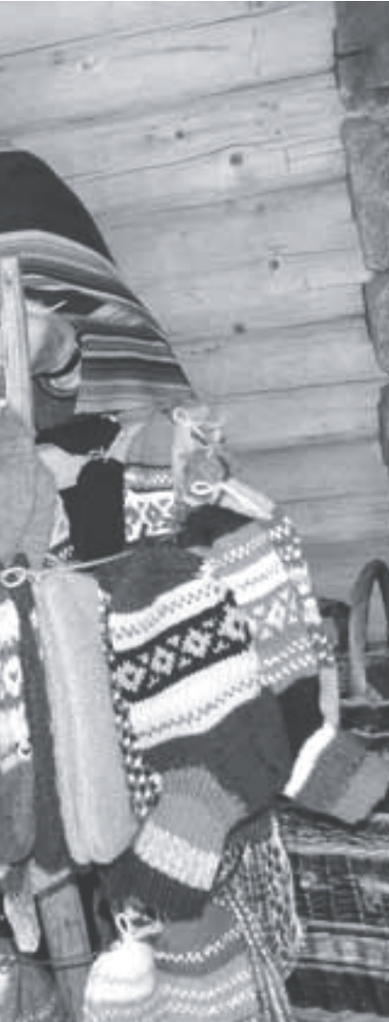
data ja soovi korral ka sokipaari kaasa

külastasime üsna suurt noortemaja, kus valla noored ise majandavad, teatrit teevad ja spordiga tegelevad.