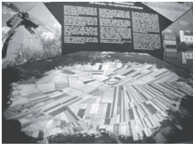
Vaade meteoriidi kaatrile õhust - kaunis graafiline põllumajandusmaastik.