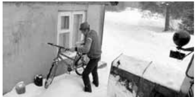
Niksul saavad puhtaks ka maja seinääred.