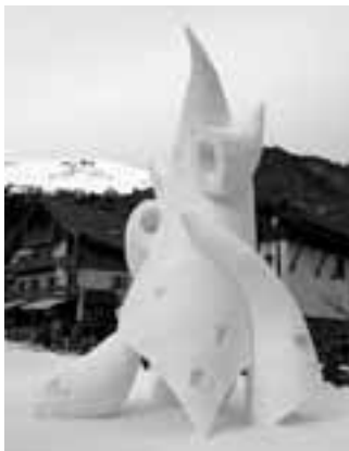
Esikoht - Kanada.