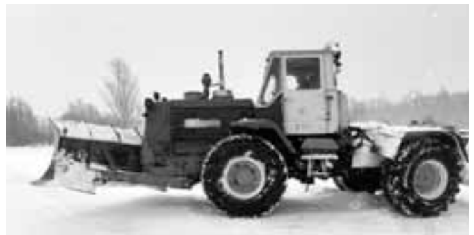
Suur, soe ja töökas T150.