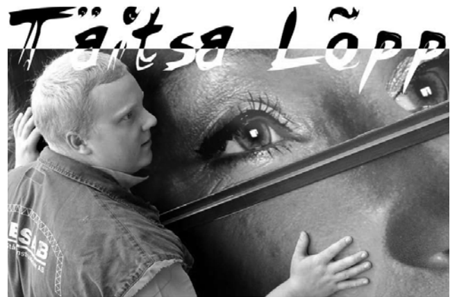
Eesti rahva enda tehtud mängufilm