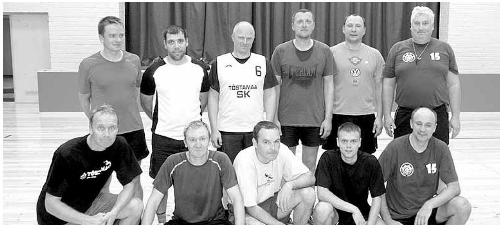
Avaliku sektori ja ettevõtjate võistkondade ühisplilt.

Huvipakkuv oli praktiline näide, kuidas veerand tunni-ga registreerida interneti teel ettevõtte.