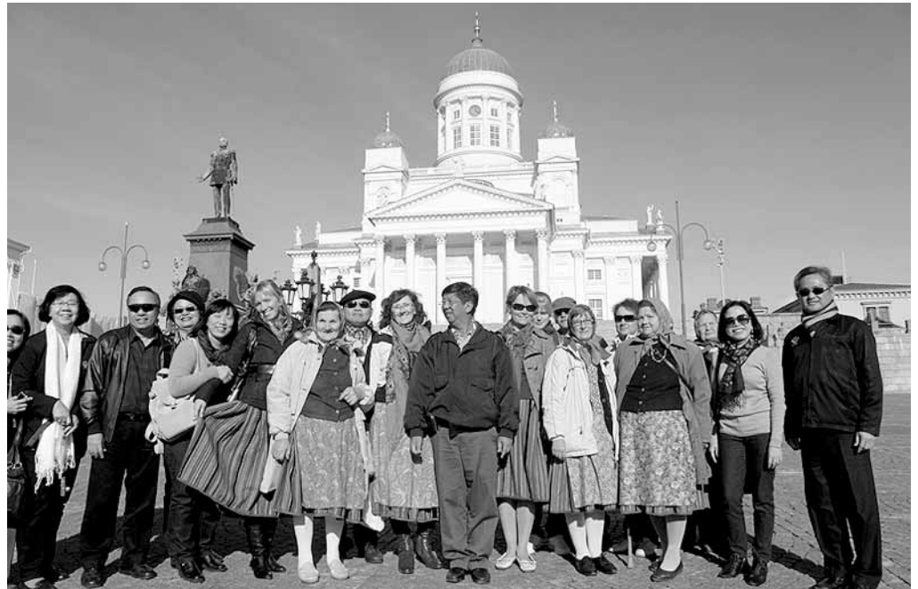
Senativaljakul saime tuttavaks lustaka reisiseltskonnaga Taimaalt.

Helsinki silakkamarkinat ehk maakeeli Helsingi räimelaat on hästi vana traditsioon, esmakordselt peeti siin kala-laata 1743. aasta mihkklipäeval. Täna on sellest kujunenud kogu oktoobrikuu esimese nädala kestav suur kultuurfestival, kus meelelahu-