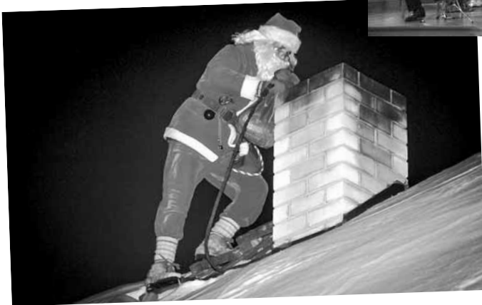
Küllap paljud on juba kuulnud, et Eestimaa jõuluvanad ehitavad omale Kõpu külas talu – Jõuluvana Korstna talu. Detsembris toimusid seal talgud, kus kõik väiksed ja suured talgulised vaatamata külmale ilmale oma osavad käed ehitusele külge panid. Kratt oli aga peitnud korstnasse suure komikoti, mille üks jõuluvana sealt välja koukis ja lastele jagas. Jõuluvanade talu ootab rohkelt külalisi juba järgmisel talvel.