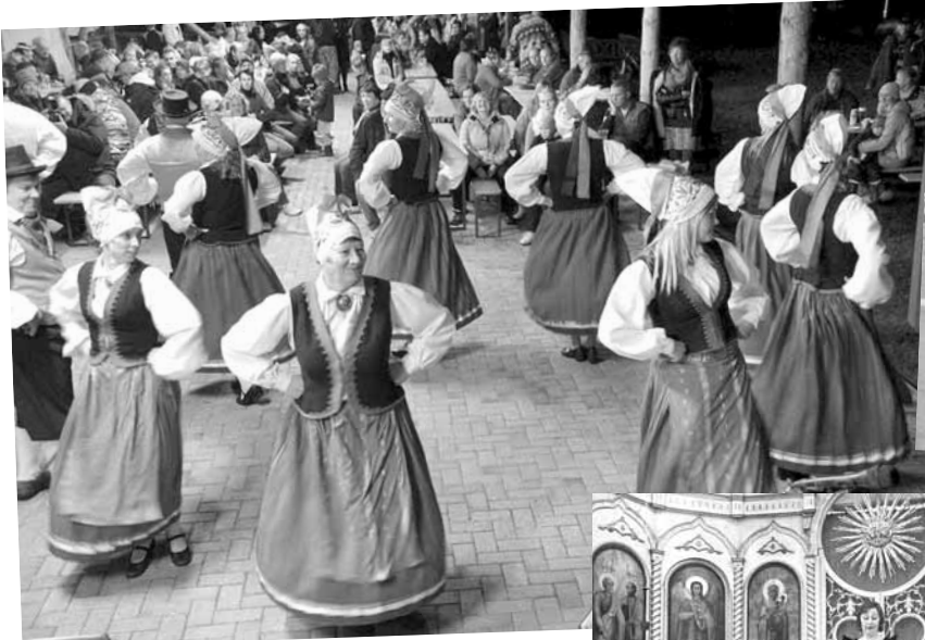
22.septembril toimus Kõpu külas Oktoobervest. 10 tundi kuldset pidu ja tühobuste demonstratsiooniesinemisi. Tere tulemast Oktoobervestile 2013, 21.septembril!