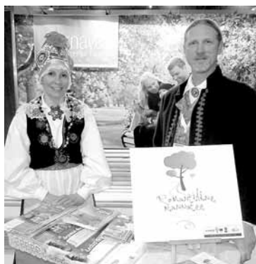
2012 aasta oli Kõpu külas tegus nagu ikka. Aasta alguses osales Maria talu kolmel turismimesil, Helsingis, Riias ja Tallinnas. Tutvustati Romantilist rannateed, Tõstamaa valda ja Maria talu. Pildil tööhoos Riia messil Balttour 2012.