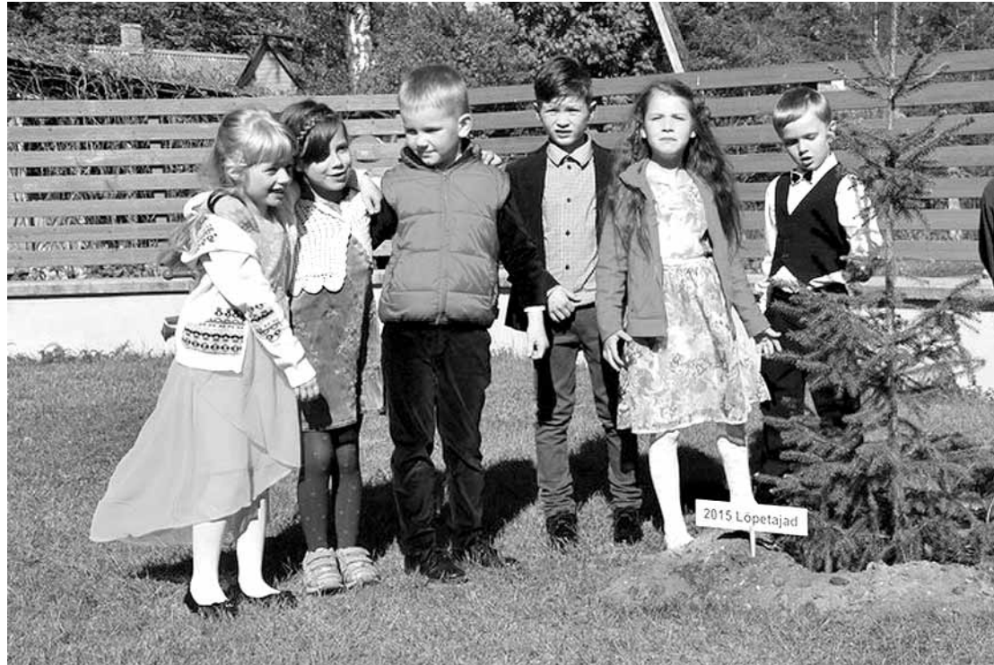
Lasteaed lennutas kooli poole teele järjekordse klassitäie lapsi, mälestuseks jääb juuri ajama päris oma rühma puu.