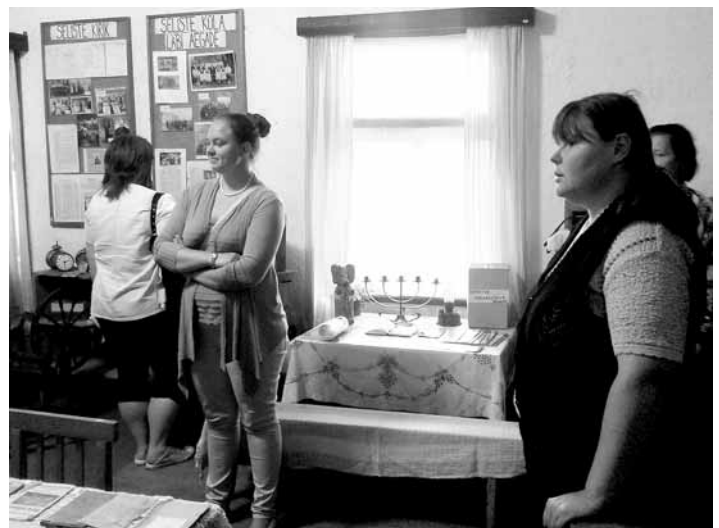
Giidikoolitusel osalejad külastamas Seliste muuseumituba.