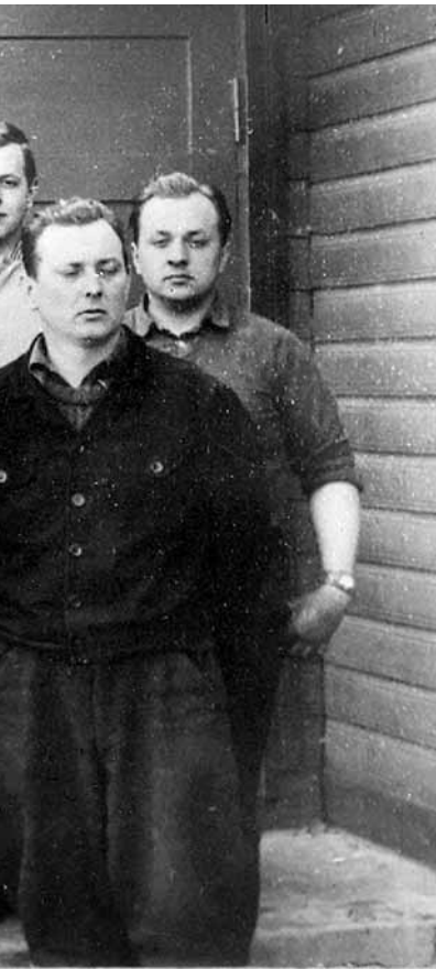
palju. Tänapäeval neist tegutsemas

kust alati, neile tasuti rahas või viljas.