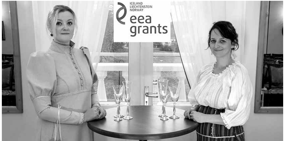
Mõisapreilid uutes kleitides uue laua ja klaasidega.

Suve jooksul on mõisa jõudnud terve hulk esemeid, mis aitavad oluliselt parandada mõisakoolis pakutavaid teenu-seid ja muuta meeleolukamaks kõiki korraldatavaid sündmusi. Rääkimata sellest, et lihtsustavad oluliselt mõisakooli töötajate tegemisi. Nüüd siis loetelu asjadest: kokkupandavad lauad,