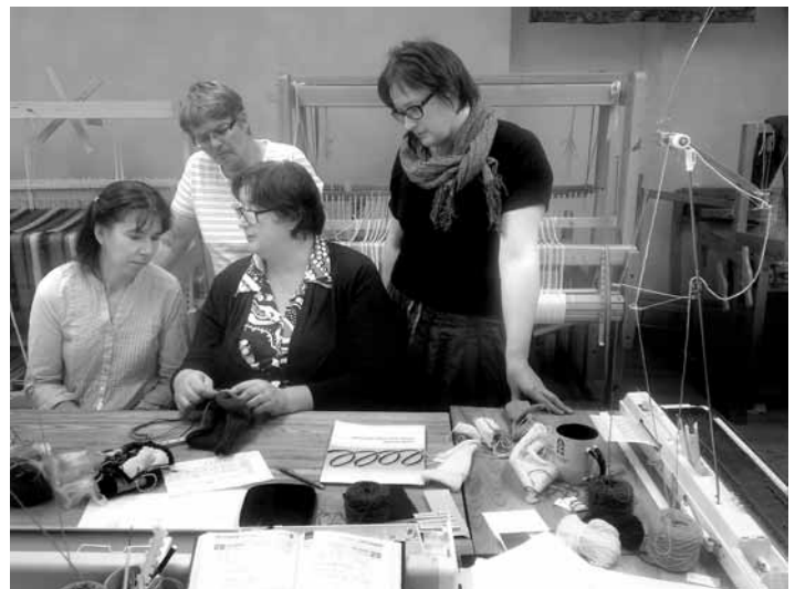
Masinkudumiskoolituse õpilased tööhoos.